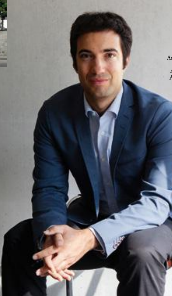
Vater, Anwalt, Politiker und stolzer Ausserrhoder: Andrea Caroni