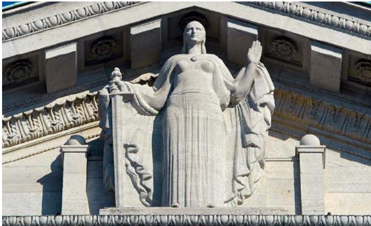
Justitia-Statue am Gebäude des Bundesgerichts in Lausanne.